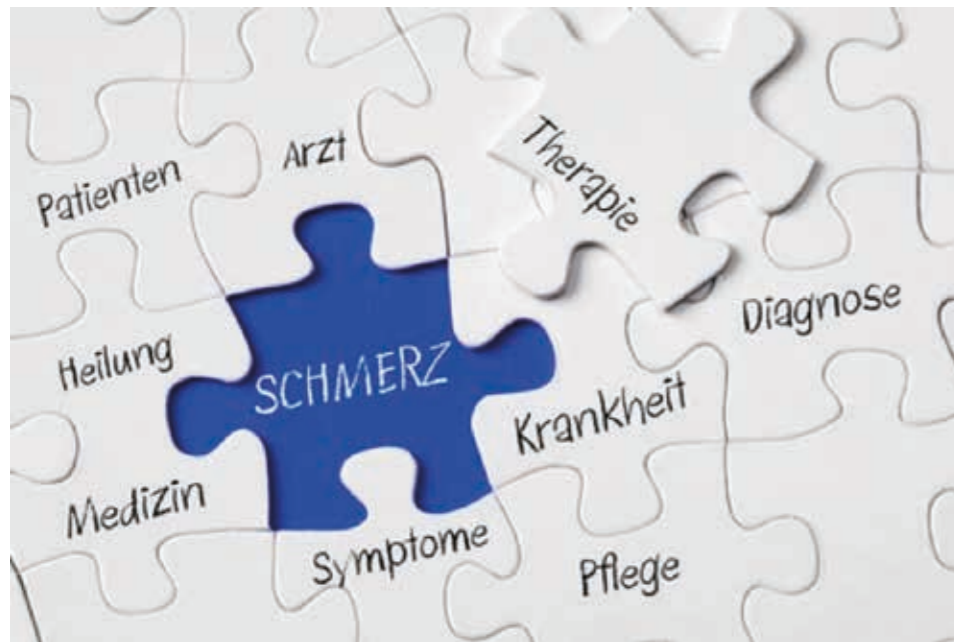
Eine Krankheit wie Rheuma hat verschiedene Puzzleteile, die stressen können und so die inneren Kräfte blockieren.