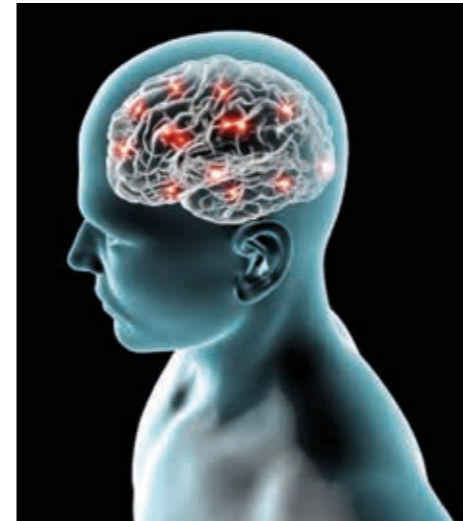
Vieles beginnt im Kopf. Mentale Techniken sind nicht nur für Spitzensportler ein Gewinn. Sondern für alle Menschen, die ihre Gedanken auf Erfolg, Gesundheit und Glück richten möchten.

Der Weg zum Erfolg ist daher eigentlich ganz einfach. Zwei Dinge müssen zusammenkommen, damit wir unsere Energien bestmöglich auf die Lösung richten: Vorstellungskraft und Entspannung. Wenn Sie sich die richtigen inneren Bilder vorstellen, wirken diese beruhigend, erholsam, können aber auch motivieren, und die inneren Kräfte anregen. Sie kombinieren Gelassenheit mit Stärke.